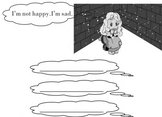
图 1 卖火柴的小女孩图片

在译林新版英语四年级下册 Unit 7 中,学生学习了 What's the matter? I'm... Are you...? Here's/Here are...for you.等表示身体感觉及询问身体情况的有关句型。为了使學生能更好掌握语言技能,教师在 PPT 上呈现“卖火柴的小女孩”的图片(见图 1)并出现对话。